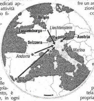
Lo Scudo punta a far rientrare i capitali dai 'Paradisi fiscali'

prima che sia troppo tardi. E nel trasferire capitali e risorse finanziarie dall'estero, Banca Mediolanum offre un ampio ventaglio di soluzioni e servizi: a partire dal conto corrente Freedom, con le sue condizioni di assoluta convenienza (tasso d'interesse al 2,5% netto), fino ai prodotti e alle soluzioni d'investimento e di risparmio gestito. In pratica, una risposta adeguata ad ogni necessità specifica, strumenti bancari e finanziari per ogni profilo di clientela. Basta presentare la propria 'dichiarazione riservata' in Mediolanum, e ogni cliente ha a disposizione la consulenza professionale e specializzata del proprio Family Banker di riferimento, che si occupa di tutti gli adempimenti, i passaggi e le attività necessarie a completare le operazioni collegate allo Scudo fiscale. Al riguardo, i Family Banker hanno anche seguito specifiche attività e seminari di formazione, alcuni in aula, alla Mediolanum Corporate University (MCU) presso la sede della Banca, altri attraverso corsi e aggiornamenti online. Il rimpatrio di beni e capitali passa anche dalla professionalità e competenza delle persone a cui vengono affidati, visto che si tratta di questioni, e patrimoni, da maneggiare con la massima cura, e riservatezza.