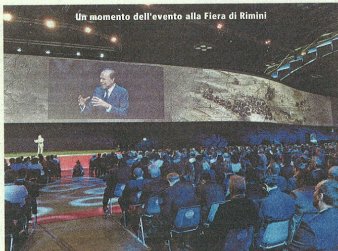
Un momento dell'evento alla Fiera di Rimini

Una buona, anzi ottima notizia per i risparmiatori, che il presidente Ennio Doris spiega con chiarezza: "Abbiamo deciso di salire subito al 3,50% dopo aver riscontrato il grande interesse che ha suscitato l'ingresso della nostra Banca nel mercato dei conti deposito presso tutti i pubblici. Eravamo già pronti, anche con le campagne pubblicitarie, internet, radio, stampa e tv con il tasso del 3,25% e quello successivo del 3,50%. La velocità di risposta dei clienti, che appena apparsa la notizia hanno sommerso di richieste di informazioni il Banking Centre e i Family Banker, ci ha spinto ad accelerare sull'offerta più aggressiva senza aspettare il periodo di rodaggio del 3,25%". Di conseguenza sono saliti anche gli interessi a sei e tre mesi: rispettivamente 2,30% annuo lordo (1,68% netto), e 1,80% annuo lordo (1,31% netto). InMediolanum affianca Conto Freedom, punta di diamante di Banca Mediolanum, arricchendo ulteriormente una gamma di servizi bancaria