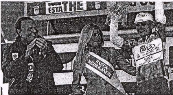
Ennio Doris premia Jose Rujano maglia verde al Giro d'Italia 2005

Già di prima mattina, anticipando la partenza del cronometro, verrà offerta l'opportunità di fare una pedalata, indossando la "maglia verde", in compagnia di un testimone d'eccezione quali Francesco Moser, Gianni Motta, Maurizio Fondriest e Roberto Conti; così come, nel pomeriggio, sempre al fianco del proprio divo dello sport, sarà possibile percorrere gli ultimi chilometri dello stesso tra-