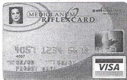
La RiflexCard personalizzata

Una banca, insomma, che sappia ascoltare e consigliare la sua clientela. Da sempre il motto di Banca Mediolanum, che si ritrova anche nella nuova campagna pubblicitaria relativa al lancio di Riflex, è quello di una banca costruita intorno ai bisogni della clientela. Obiettivo reso possibile, da un lato, soddisfacendo il ventaglio di esigenze della clientela, compresi i servizi di tipo assicurativo, dall'altro mettendo a disposizione la sua rete di quasi 5mila Consulenti Globali, in grado di fornire professionalità e consulenza, garantendo la massima chiarezza in tutta la gamma di operazioni bancarie e finanziarie.