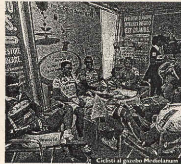
Ciclisti al gazebo Mediolanum

Premio della Montagna, il quinto per lui. Il Giro d'Italia, con tutte le qualità necessarie per vincerlo, è da sei anni una metafora per Banca Mediolanum, sponsor della Maglia Verde, che dal 1974 indossa il ciclista che durante la manifestazione si è aggiudicato il Gran Premio della Montagna, totalizzando più punti nelle tappe in salita. Lo stesso vale negli investimenti: conta il risultato sul lungo periodo, non i tonfi o gli exploit momentanei. La «corsa» è programmata, e va continuata anche quando non si sta «comodamente» pedalando in pianura, ma si sta arancando in un tratto tutto in salita. A chi crede, cioè ai clienti che condividono «filosofia», Banca Mediolanum ha offerto anche quest'anno la possibilità di seguire il Giro da vicino, dal giorno del via, il 10 maggio a Palermo, fino alla sua conclusione, fissata per il 1° giugno a Milano, insieme con testimonial che hanno fatto grande il ciclismo italiano: Francesco Moser, Gianni Motta e