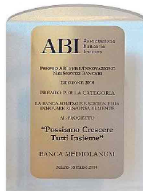
Il premio assegnato dall'ABI

Solamente nel corso del 2013, in seguito alle numerose alluvioni che hanno colpito diverse regioni italiane, Banca Mediolanum è intervenuta stanziando 1.600.000 euro a favore delle famiglie dei clienti e Family Banker che hanno subito danni. Oltre a ciò, sono state previste diverse agevolazioni tra le quali la possibilità di sospensione della rata mutui e prestiti per 12 mesi, l'attivazione di linee di credito privilegiate, la riduzione di un punto percentuale dello spread in essere su mutui e prestiti per 24 mesi e l'azzeramento di tutti i costi dei conti correnti e deposito Titoli per 24 mesi. Interventi messi in campo anche negli scorsi anni in occasione del terremoto in Emilia-Romagna, e prima ancora in Abruzzo, delle allu-