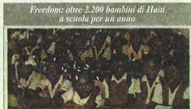
Freedom: oltre 2.200 bambini di Haiti a scuola per un anno

collegato: per ogni nuovo Conto Freedom, aperto dal primo ottobre scorso fino al prossimo 31 marzo, Banca Mediolanum garantirà un mese di scuola a un bambino di Haiti, sostenendo le attività della Fondazione Francesca Rava N.P.H. Italia Onlus, in stretta collaborazione con Fondazione Mediolanum. Un'iniziativa che, attraverso la sovvenzione a carico esclusivamente della Banca e non del correntista, dall'inizio di ottobre 2010 ha già permesso di donare a oltre 2.200 bambini haitiani la possibilità di frequentare la scuola per un intero anno. In sostanza, convenienza, vantaggi e solidarietà, insieme in un conto corrente.