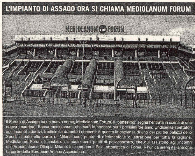
Il Forum di Assago ha un nuovo nome, Mediolanum Forum. Il «battesimo» segna l'entrata in scena di una nuova «madrina», Banca Mediolanum, che sarà lo sponsor per i prossimi tre anni. Undicimila spettatori agli incontri sportivi, tredicimila durante i concerti: è questa la capienza di uno dei più bei palazzi dello Sport, situato alle porte di Milano sud, punto di riferimento e di attrazione per tutta la regione. Mediolanum Forum è anche un simbolo per i patiti di pallacanestro, che qui assistono agli incontri dall'Armani Jeans-Olimpia Milano. Insieme con il PalaLottomatica di Roma, è l'unica arena italiana che fa parte della European Arenas Association.

sempre della casa. Creato un nuovo servizio finanziario (Double Chance), parte dei cui guadagni della Banca vadano ad alimentare il fondo (previsti 50 milioni per i prossimi 22 anni). L'8 ottobre fu comunicata l'acquisizione dei mutui che 1.742 clienti Mediolanum avevano concluso con Fonsapbank (gruppo Morgan Stanley), allo scopo di permettere anche a loro di godere dei benefici riservati a tutti coloro che già avevano un mutuo con l'Istituto milanese: benefici grazie ai quali i 1.742 mutuatari risparmieranno complessivamente 18 milioni di euro. Costo dell'acquisizione: 170 milioni di euro. Infine, il salvataggio dei clienti che avevano sottoscritto polizze legate a obbligazioni Lehman. Tutti questi interventi discendono dal medesimo concetto-guida di Mediolanum: la centralità del cliente. E confermano anche la teoria dell'etologo olandese. Se mai lo scienziato ne avesse bisogno, sappia che a Mediolanum abbiamo la prova empirica che la sua teoria ha un fondamento: tre settimane dopo l'annuncio del calo dello spread, a Mediolanum erano arrivate 12mila richieste di nuovi mutui e in ottobre la Banca ha triplicato il numero dei prestiti erogati. Quanto all'operazione Lehman, si è rivelata, ha dichiarato il presidente Ennio Doris, «l'investimento più produttivo che potevamo fare, oltre qualsiasi immaginazione».