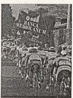
Il gruppo dei corridori durante il Giro d'Italia del 2006. Anche quest'anno Banca Mediolanum sponsorizza la Maglia Verde del Gran Premio della Montagna

Partendo il via il 12 maggio, il 90° Giro d'Italia e per celebrare l'evento Banca Mediolanum, per il IV anno consecutivo sponsor ufficiale della Maglia Verde del Gran Premio della