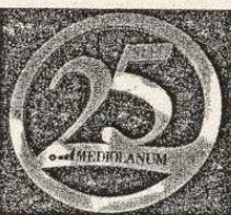
Quest'anno ricorre il 25° anniversario della nascita del Gruppo Mediolanum, fondato da Ennio Doris il 2 febbraio del 1982