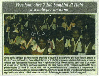
Oltre 2.200 bambini di Haiti stanno andando a scuola, e di andranno per tutto l'anno, grazie al Conto Corrente Freedom. Banca Mediolanum si è infatti impegnata, alla fine dell'estate scorsa, a versare alla Fondazione Francesca Rava - Nph Italia Onlus il corrispettivo per i costi di un mese di scuola di un bambino dell'isola caraibica per ogni nuovo conto Freedom sottoscritto fra il primo ottobre 2010 e il 31 marzo 2011. Nel segno della massima concretezza e trasparenza di questo impegno solidale da parte della Banca, sull'home-page del sito www.bancamediolanum.it ogni settimana viene pubblicato e comunicato il dato aggiornato dei risultati raggiunti.

Un'iniziativa che, attraverso la sovvenzione a carico esclusivo della Banca e non del correntista, dall'inizio di ottobre 2010 ha già permesso di donare a oltre 2.200 bambini haitiani la possibilità di frequentare la scuola per un intero anno. In sostanza, convenienza, vantaggi e solidarietà, insieme in un conto corrente.