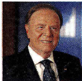
Ennio Doris spiega il successo di un modello che è riuscito a battere la crisi