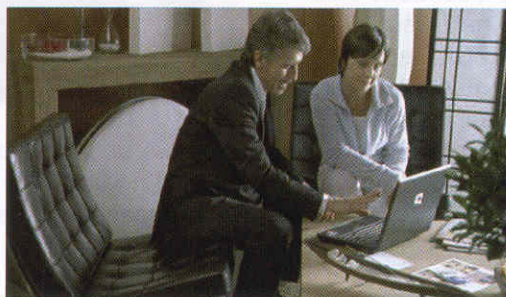
Consulenza specializzata con i Global Banker

Mentre le altre banche hanno filiali e sportelli tradizionali, dove la consulenza al cliente è ancora in gran parte standardizzata, oppure il servizio viene fornito attraverso piattaforme online, dove il contatto personale e diretto è del tutto inesistente, il Family Banker rappresenta il fulcro e l'anello di congiunzione tra Banca Mediolanum e tutti i suoi clienti in ogni parte del Paese. Dalle grandi città ai pic-