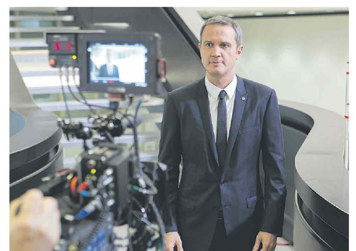
Massimo Doris durante le riprese del nuovo spot di Banca Mediolanum

■ ■ ■ Una Banca solida e conveniente, costruita intorno al cliente e che a quest'ultimo si rivolge con numerosi prodotti e servizi dedicati ma soprattutto studiati per migliorare la qualità della vita e dello stesso portafoglio: è questo il messaggio della nuova campagna pubblicitaria di Banca Mediolanum in onda dal 28 giugno per 4 settimane sui principali mezzi di comunicazione. Protagonista del nuovo spot, con la regia di Dario Piana e la direzione creativa di Roberto Vella, è l'amministratore delegato, Massimo Doris, che presenta i punti di forza della banca. Innanzitutto la convenienza dei prodotti offerti, tra cui il conto corrente a canone zero che consente di prelevare gratuitamente ad ogni sportello e di effettuare le principali operazioni bancarie a zero spese. Una banca completa e multicanale che si interessa ad ogni aspetto della vita del cliente: consapevole del fatto che risparmiare tempo significa risparmiare denaro Banca Mediolanum, grazie al suo approccio tecnologico e all'avanguardia è in grado infatti di offrire prodotti innovativi che riducono il tempo impiegato per effettuare pagamenti. Grazie ad esempio alla carta contactless è possibile pagare le proprie spese con un semplice movimento avvicinando la carta di pagamento al lettore abilitato. Un risparmio di tempo e di denaro che si coniuga alla