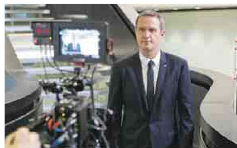
Massimo Doris durante le riprese del nuovo spot di Banca Mediolanum

Una banca completa e multicanale che si interessa ad ogni aspetto della vita del cliente: consapevole del fatto che risparmiare tempo significa risparmiare denaro Banca Mediolanum, grazie al suo approccio tecnologico e all'avanguardia è