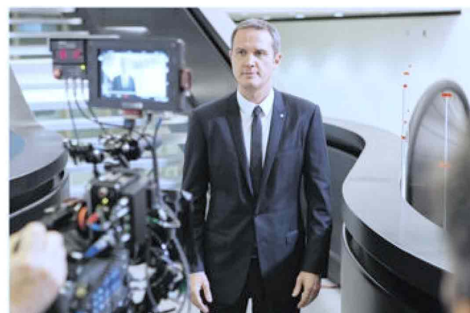
Massimo Doris durante le riprese del nuovo spot di Banca Mediolanum

Innanzitutto la convenienza dei prodotti offerti, tra cui il conto corrente a canone zero che consente di prelevare gratuitamente ad ogni sportello e di effettuare le principali operazioni bancarie a zero spese. Una banca completa e multicanale che si interessa ad ogni aspetto della vita del cliente: consapevole del fatto che risparmiare tempo significa risparmiare denaro Banca Mediolanum, grazie al suo approccio tecnologico e all'avanguar-