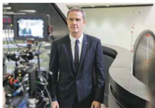
Massimo Doris durante le riprese del nuovo spot di Banca Mediolanum

Protagonista del nuovo spot, con la regia di Dario Piana e la direzione creativa di Roberto Vella, è l'amministratore delegato, Massimo Doris, che presenta i punti di forza della banca. Innanzitutto la convenienza dei prodotti offerti, tra cui il conto corrente a canone zero che consente di prelevare gratuitamente ad ogni sportello e di effettuare le principali operazioni bancarie a zero spese. Una banca completa e multicanale che si interessa ad ogni aspetto della vita del cliente: consapevole del fatto che risparmiare tempo significa risparmiare denaro Banca Mediolanum, grazie al suo approccio tecnologico e all'avanguardia è in grado infatti di offrire prodotti innovativi che riducono il tempo impiegato per effettuare pagamenti. Grazie ad esempio alla carta contactless è