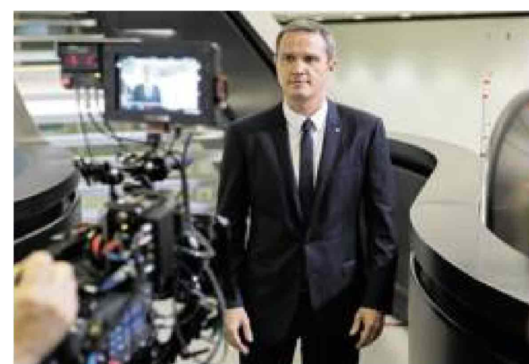
Massimo Doris durante le riprese del nuovo spot di Banca Mediolanum

Innanzitutto la convenienza dei prodotti offerti, tra cui il conto corrente a canone zero che consente di prelevare gratuitamente ad ogni sportello e di effettuare le principali operazioni bancarie a zero spese. Una banca completa e multicanale che si interessa ad ogni aspetto della vita del cliente: consapevole del fatto che risparmiare tempo significa risparmiare denaro Banca Mediolanum, grazie al suo approccio tecnologico e all'avanguardia è in grado infatti di offrire prodotti innovativi che riducono il tempo impiegato per effettuare pagamenti. Grazie ad esempio alla carta contactless è possibile pagare le proprie spese con un semplice movimento avvi-