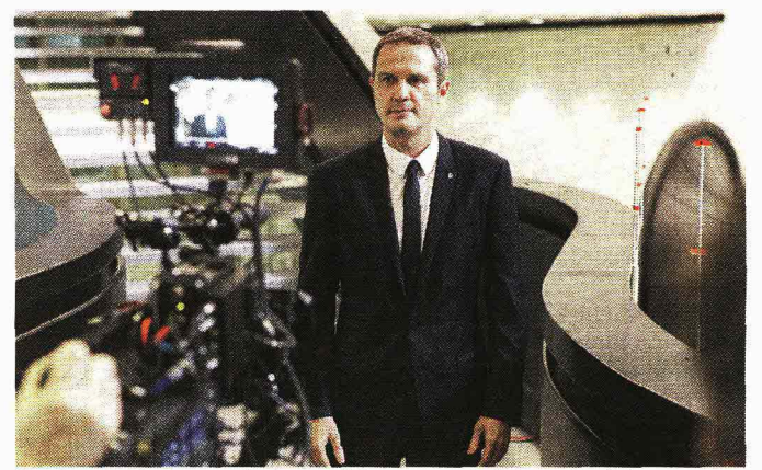
Massimo Doris durante le riprese del nuovo spot di Banca Mediolanum

Una banca completa e multicanale che si interessa ad ogni aspetto della vita del cliente: consapevole del fatto che risparmiare tempo significa risparmiare denaro Banca Mediolanum, grazie al suo approccio tecnologico e all'avanguardia è in grado infatti di offrire prodotti innovativi che riducono il tempo impiegato per effettuare pagamenti. Grazie ad esempio