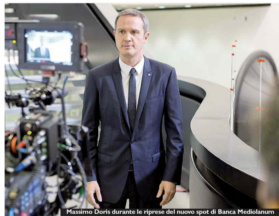
Massimo Doris durante le riprese del nuovo spot di Banca Mediolanum

Una Banca solida e conveniente, costruita intorno al cliente e che a quest'ultimo si rivolge con numerosi prodotti e servizi dedicati ma soprattutto studiati per migliorare la qualità della vita e dello stesso portafoglio: è questo il messaggio della nuova campagna pubblicitaria di Banca Mediolanum in onda dal 28 giugno per 4 settimane sui principali mezzi di comunicazione. Protagonista del nuovo spot, con la regia di Dario Piana e la direzione creativa di Roberto Vella, è l'amministratore delegato, Massimo Doris, che presenta i punti di forza della banca. Innanzitutto la convenienza dei prodotti offerti, tra cui il conto corrente a canone zero che consente di prelevare gratuitamente ad ogni sportello e di effettuare le